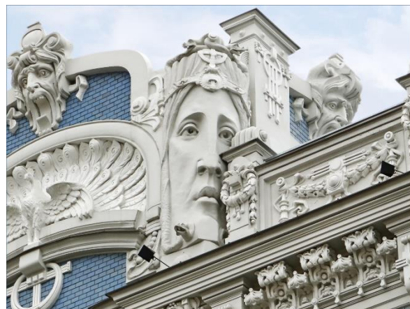
Karniisi ja viilu kaunistused majal Albert tänavas